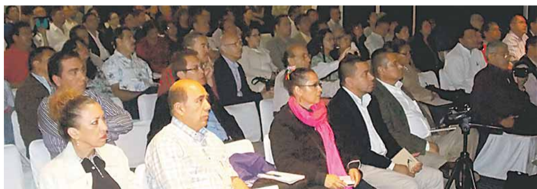
MÁS de 200 doctores provenientes de toda la República asistieron al el Curso Internacional de Ultrasonido en Obstetricia y Diagnóstico Prenatal.