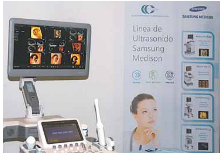
EQUIPOS de última generación de SAMSUNG MEDISON