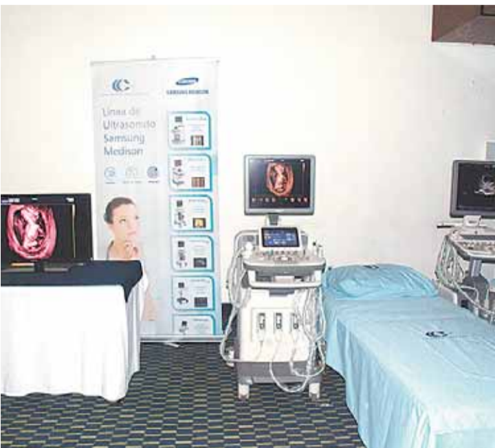
SAMSUNG MEDISON presentó lo más reciente en tecnología.